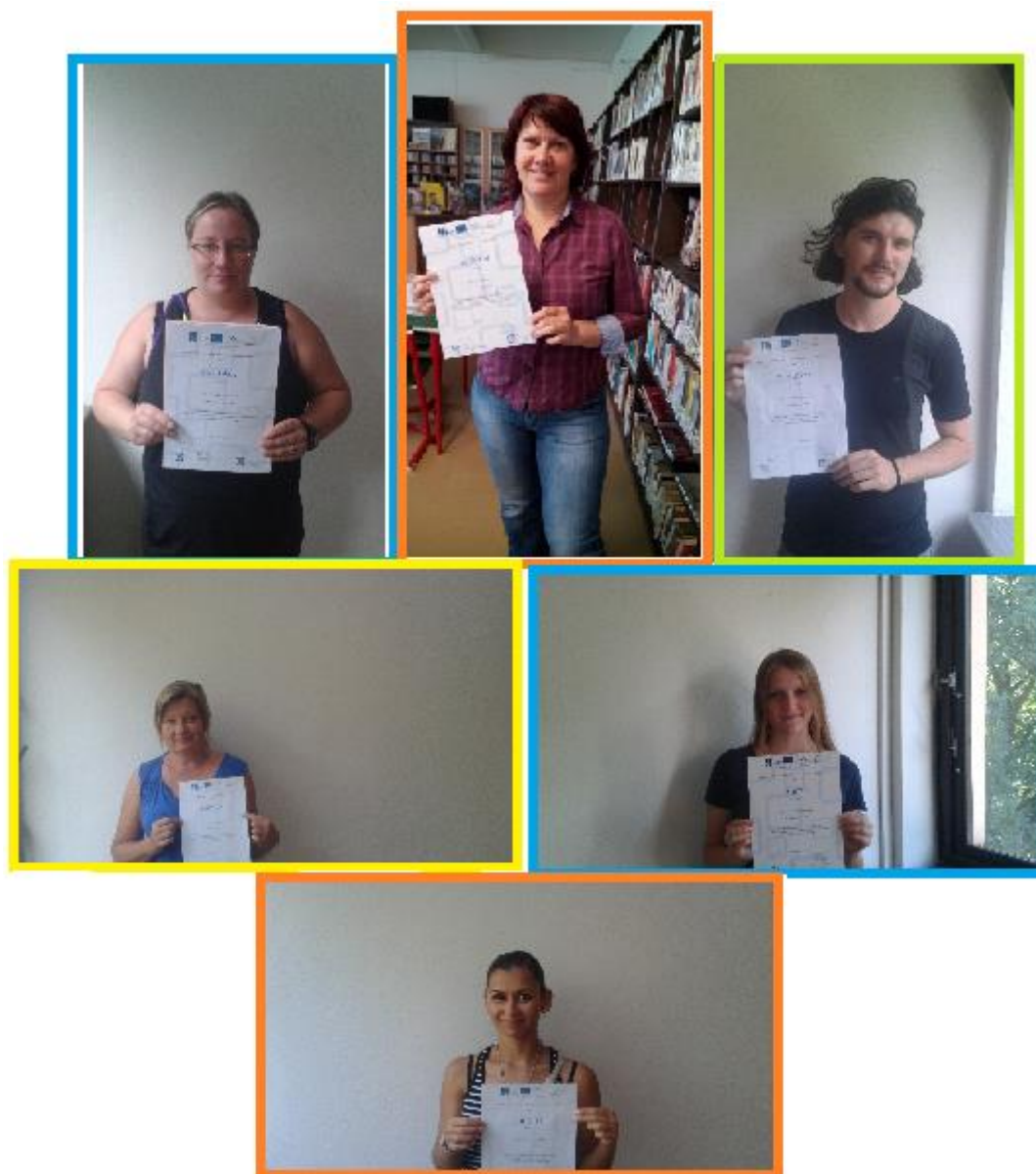
Někteří z úspěšných stážistů. Gratulujeme!