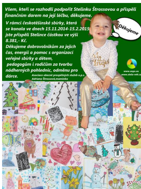
Stelinka na pohlednicích malovaných dětmi z Českého Těšína

Díky všem zapojeným dobrovolníkům a solidaritě veřejnosti Českého Těšína bylo shromážděno celkem 8381,- Kč, které byly předány mamince Stely.